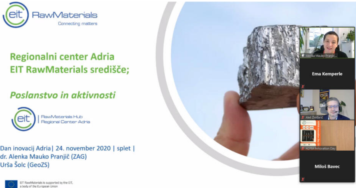
Slika 2: Predstavitev aktivnosti Regionalnega centra Adria.