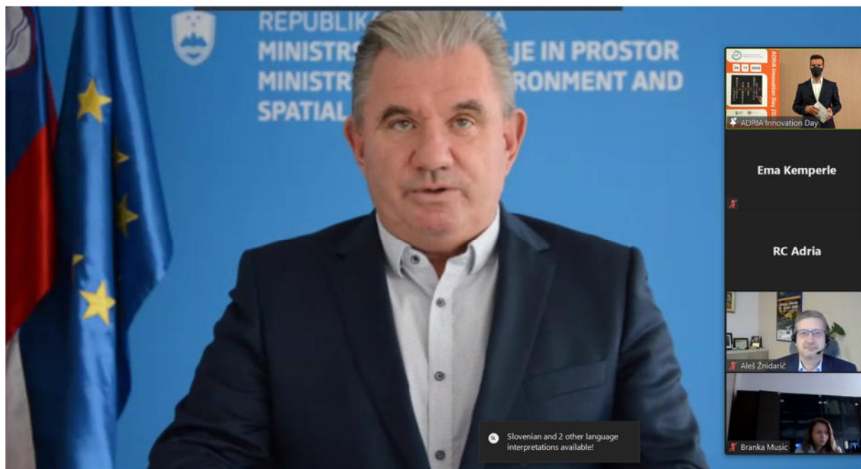
Slika 1: Nagovor mag. Andreja Vizjaka, ministra za okolje in prostor.

Celoten dogodek je potekal v organizaciji Regionalnega centra Adria, ki deluje v okviru skupnosti za surovine Evropskega inštituta za inovacije in tehnologijo in ga v Sloveniji skupaj koordinirata Zavod za gradbeništvo Slovenije (ZAG) in Geološki zavod Slovenije (GeoZS).